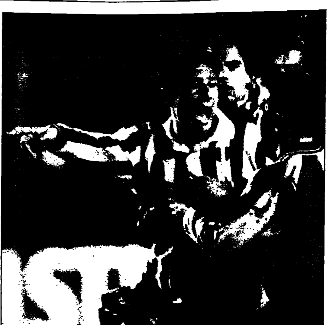
اللاعب الدولي الروماني حاجي يمسد حرة لفرقة غلطة سراي بينما يحاول لاعبو يوفنتوس التصدي له